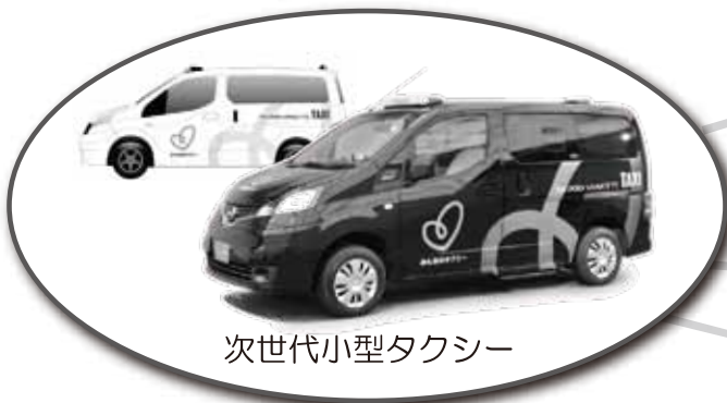
次世代小型タクシー